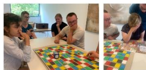
Vakantiewerking Thema: zintuigen